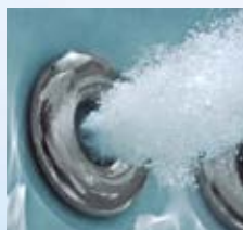
Massaggio a rotazione antistress