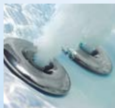
Massaggio localizzato a pressione

Un massaggio su misura per ogni parte del corpo