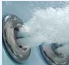
Massaggio a rotazione drenante